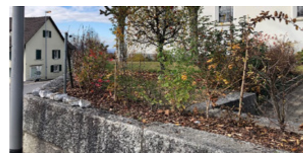
Gemischte Wildsträucherhecke Kirche St. Martin

Nachdem an der Kirchgemeindeversammlung 2020 das Projekt «Grüner Guggel» gutgeheissen wurde, konnte im März 2021 die 1. Sitzung stattfinden.